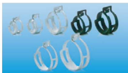
7 ホースクランプ(ホースクリップ)

圧縮ばねをはじめ、引張ばね、ねじりばね等、品質とコストを考慮した徹底した機械化と自動化により幅広いニーズにお答えします。