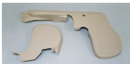
2 2色成形(シートサイドシールド)

従来、二つの部品を成形→溶着等行っていた物を1台の成形機で同時に完成部品として成形しております。コストダウン、短納期に成功しています。