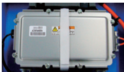
8 EV車用温水ヒーター

水冷系、燃料系、エアー系などのホース止め用。自動車等のエンジンルーム内でのホルダー飛散防止や、廃棄物の低減を実現。種類も豊富で、ホースサイズに合わせ標準化されています。