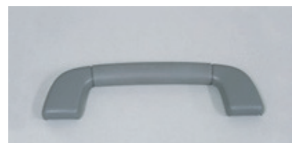
3 ガスインジェクション(アシストグリップ)

従来、二つの部品を成形→溶着等行っていた物を1台の成形機で同時に完成部品として成形しております。コストダウン、短納期に成功しています。