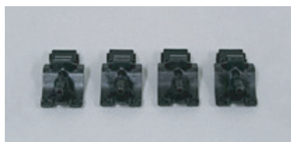
1 精密小物部品(カーウインドウオッシャ)