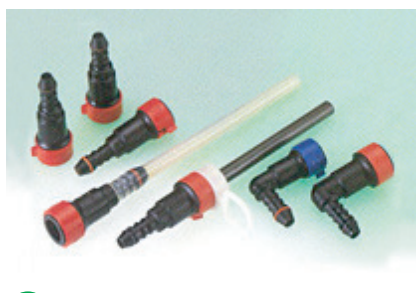
5 クイックコネクター

自動車の各部位に使用しています。特殊な配線など、様々なタイプに対応しています。【用途:パワーシート等】